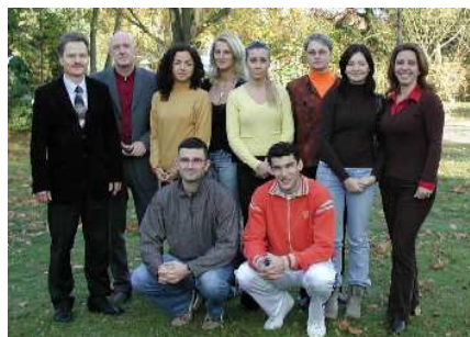
Junges Team aus mehreren SOE-Staaten

Das siebte Jahr in Folge ist die Berliner Managementbildungsstätte Bildungszentrum am Müggelsee in die „Qualifizierungspartnerschaft Südosteuropa“ einbezogen. Im November starteten erneut zwei Kurse für Führungskräfte aus dieser Region. Die Teilnehmer kamen diesmal aus den Staaten Bosnien, Montenegro, Serbien und aus dem Kosovo-Gebiet und sind zumeist in der Tourismusbranche tätig. Unter den montenegrinischen Kursanten befanden sich auch zwei Vertreter des Umweltministeriums in Podgorica. Den Studiengästen wurde vor allem Expertenwissen in den Themenfeldern Marketing, Außenwirtschaft und Europäische Förderprogramme für Südosteuropa vermittelt. An diese inhaltliche Einstimmung im BZM schließt sich ein Praxisabschnitt an, den die Kursanten in deutschen Unternehmen absolvieren, zu denen bereits Geschäftsbeziehungen bestehen. In diesem Fall handelt es sich u. a. um die Reiseveranstalter Robinson-Club, Thomas Cook und TUI. Ein Praktikum bei REWE